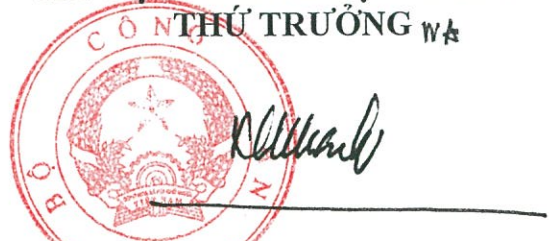
Thượng tướng Lê Quý Vương